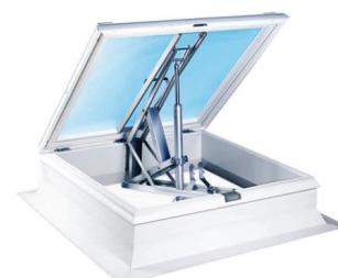
Kan leveres med ovenlysvindue